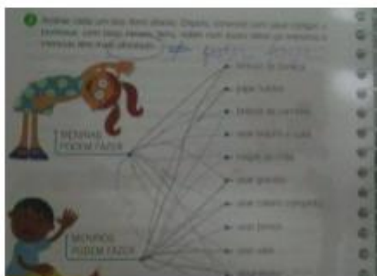
A apostila da Editora Positivo apresenta exercício que discute as questões de gênero.

estar na sociedade, produzindo assim os sujeitos, torna-se importante agregar em suas práticas pedagógicas a educação para a sexualidade, enquanto um componente curricular. E, a partir desse projeto, no qual as questões de gênero irão tornar-se discussões obrigatórias nas escolas, é possível perceber algumas mudanças, a fim de construir uma sociedade mais justa e igualitária e também nas problematizações que têm ficado às margens e que passam a ser pensadas como componentes desse artefato pedagógico, que é o currículo escolar.