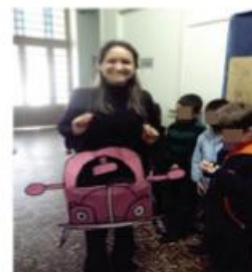
A estagiária e o fusquinha