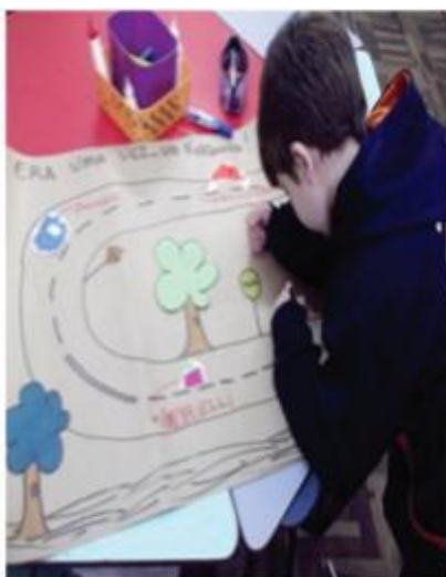
Atividade sobre o trânsito

consigo estas marcas. São histórias cheias de significados, as crianças estão se produzindo, tem entre 6 e 7 anos e já pensam assim, separando brinquedos e brincadeiras em coisas de meninas e de meninos. Nem mesmo sabem o que significa ser marica e já discriminam o outro por gostar do rosa, do azul, da boneca e da bola. Penso que a escola deve sim trabalhar desde cedo com estas questões, quebrar estes preconceitos que atravessam a educação para que quando chegue a idade adulta não se tornem adultos cheios de preconceitos que discriminam o próximo.