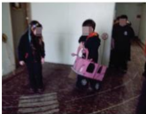
Vamos aprender a dirigir?

meninas logo foram dizendo: De carrinho a gente também não brinca. Então uma menina disse: Nada a ver mulher também dirige carro e melhor que os meninos!. E começaram as discussões, até que um menino me olhou e disse: Professora eu acho que o meu padrasto é! Eu perguntei: É o que? É marica prof! Sabes porquê? Ele usa camiseta rosa e todo homem que usa coisa rosa é marica. A partir desse relato do menino, eu busquei mediar a situação e promover uma discussão com a turma dizendo que rosa é uma cor como todas as outras e perguntei para ele quem tinha dito aquilo, e ele prontamente me respondeu: Meu pai que é muito homem, ele me disse que homem de verdade não usa rosa e nem compra florzinha de mulher.