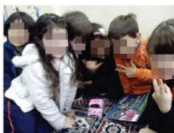
A turma do 1º ano