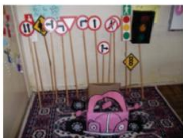
O fusca e as placas de trânsito

Ao conhecer a história da Bia e do Beto, imediatamente pensei: este livro vai dar o que falar! Preparei uma caixa mágica para contar a história e construí um fusquinha rosa para que este saísse de dentro da caixa. Todos sentados em roda comecei a contar a história. As crianças estavam atentas e curiosas para ver o que tinha dentro da caixa e, como no livro os brinquedos ganhavam vida depois da meia noite, com o fusquinha não iria ser.