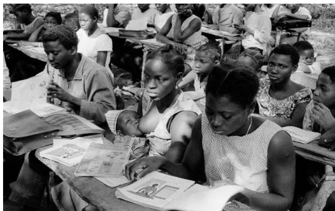
FIGURA 01 - Presença das mulheres guineenses nas Escolas das Zonas Libertadas.

Durante o período de luta armada (1963-1973), a cada território reconquistado dos colonizadores, o PAIGC criava uma escola, denominada Escola das Zonas Libertadas (Figura 01). Dentre os objetivos desta iniciativa destaca-se: Alfabetização – levando em consideração que aproximadamente 98% da população era analfabeta; Reafricanização – incorporando conceitos africanos ligados à cultura; Política – buscando despertar consciência do que é o colonialismo, a opressão e a exploração em geral, além de incorporar temas como as questões de gênero, visando avançar quanto aos direitos de mulheres e crianças em um contexto em que a dominação patriarcal feudal e colonial estava entrelaçada, o que líderes do PAIGC, como Carmen Pereira, chamavam de “dois colonialismos”. A Figura 01 é ilustrativa a esse respeito.