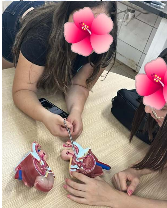
Figura 2: Residentes manipulando o modelo

O modelo didático foi entregue ao grupo participante, que foi orientado a simular uma cirurgia de vasectomia, sem nenhuma orientação prévia, apenas com a disponibilização de tesouras e pinças cirúrgicas. Desse modo, o grupo realizou a ação manipulativa da SEI (Figura 2). Durante essa etapa, foram mobilizados saberes acerca da estrutura e fisiologia do SUT. Em seguida, o grupo foi questionado sobre como a vasectomia funciona e quais os possíveis efeitos colaterais da cirurgia.