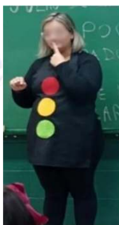
Figura 1. Uso do avental, simbolizando um semáforo

A ação de extensão contou com a participação de 80 crianças de nove turmas dos anos iniciais do ensino fundamental, compreendendo a faixa etária entre 6 e 11 anos. Em consonância com a direção da escola, foi agendado previamente um encontro, de uma hora na própria sala de aula, com cada uma das turmas. Além das crianças e da ministrante, participavam também duas agentes comunitárias de saúde e os educadores. Após as apresentações individuais de todos os envolvidos, era exposto as formas de violência e a ministrante vestia um avental (figura 1) que continha os sinais do semáforo (vermelho, amarelo e verde), instigando os participantes a responderem o que esses sinais representam e significam dentro das leis de trânsito. Assim, era feita a assimilação destes sinais no corpo humano, como forma de evidenciar os locais proibidos, permitidos e de atenção ao toque por outras pessoas.