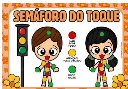
Figura 5. Imagem do gabarito utilizado

Segundo as buscas realizadas nas mídias digitais, a boca é sempre sinalizada como um local proibido ao toque, sendo pintada na cor vermelha que simboliza a proibição, conforme a imagem utilizada como gabarito para análise das imagens coloridas pelas crianças (figura 5).