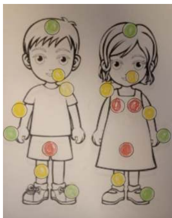
Figura 4. Pinturas de crianças com a boca em amarelo, sinal de atenção

Durante as pinturas e manipulação do boneco de tecido, não houve relatos ou identificação de situações de abuso sexual. No entanto, quatro casos chamaram a atenção quando as crianças pintaram a boca com o amarelo, não reconhecendo esse local como proibido (figura 4).