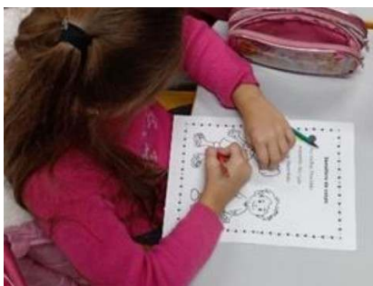
Figura 3. Identificação dos sinais do semáforo em pintura

Também foi entregue para as crianças mais uma cópia da imagem de esboço do corpo humano para que pudessem levar para casa e colorir com suas famílias. Além dos alunos, os educadores também ficavam com o material impresso para registro da atividade.