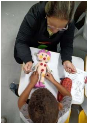
Figura 2. Manipulação do boneco de tecido com pontos autocolantes

ministrante. Na ocasião, cada turma escolhia um nome para o boneco e assim estabeleciam um maior vínculo com a ação.