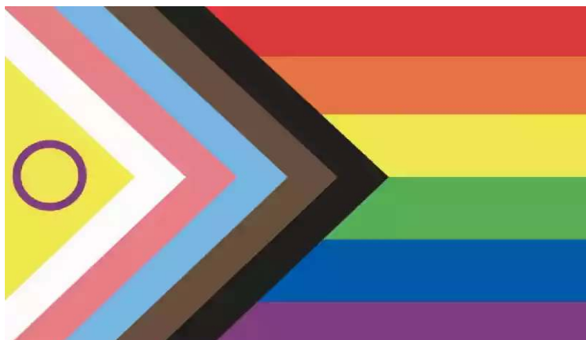
FIGURA 3 – Nova bandeira LGBTI+.