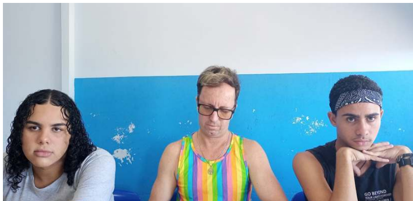
FIGURA 5 – Filmagem do curta-metragem: ““Banheiros para todas, todes e todos!””.