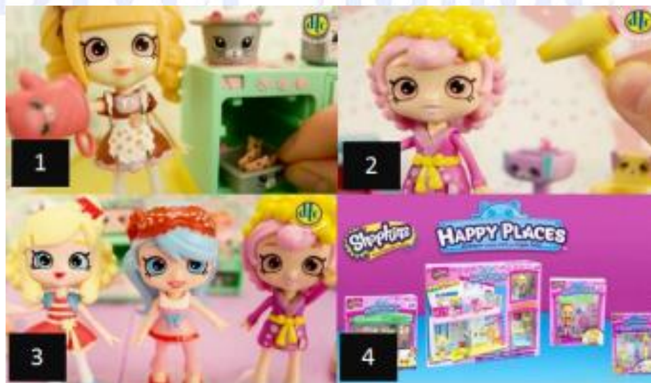
FIGURA 4: Cenas da propaganda do brinquedo Shopkins Happy Places .

A propaganda Shopkins Happy Places traz pequenas bonecas que cuidam de sua beleza e saúde, que tomam banho de espuma em uma banheira, que cozinham e são vaidosas, utilizando produtos de beleza.