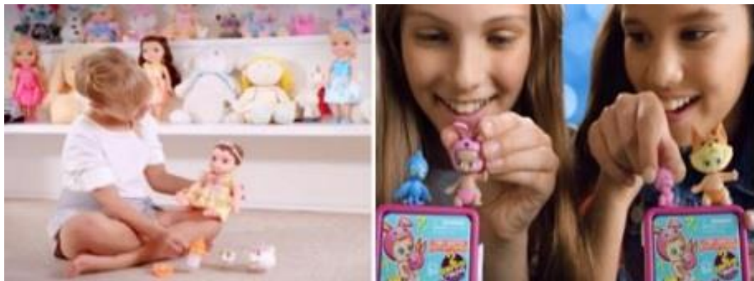
FIGURA 3: Cenas das propagandas Baby Princesas Disney e Twozies.

Mostramos cenas das propagandas dos brinquedos Baby Alive hora de comer e Little Mommy , respectivamente. Na primeira cena (da esquerda), a menina alimenta sua boneca, que reproduz a fala: - “ Mamãe, estou com fome! ”, reforçando a questão da maternidade ao chama-la de mamãe. Na segunda cena (da direita), a menina coloca sua boneca no colo e a faz dormir, novamente reforçando o papel da menina na maternidade.