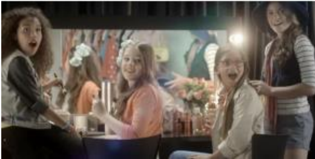
FIGURA 3: Cena da propaganda do brinquedo Trendy Dogs.

Os brinquedos Shopkins Happy Places e Trendy Dogs trazem como protagonistas meninas brancas e magras em suas propagandas. Os produtos estão relacionados a brinquedos ligados a produtos de beleza.