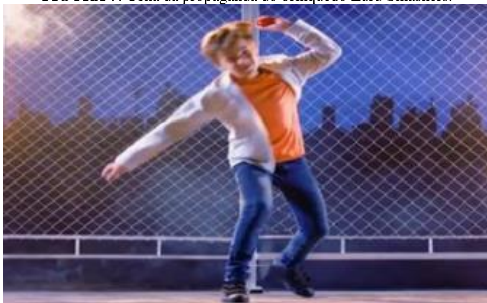
FIGURA 7: Cena da propaganda do brinquedo Zuru Smashers .