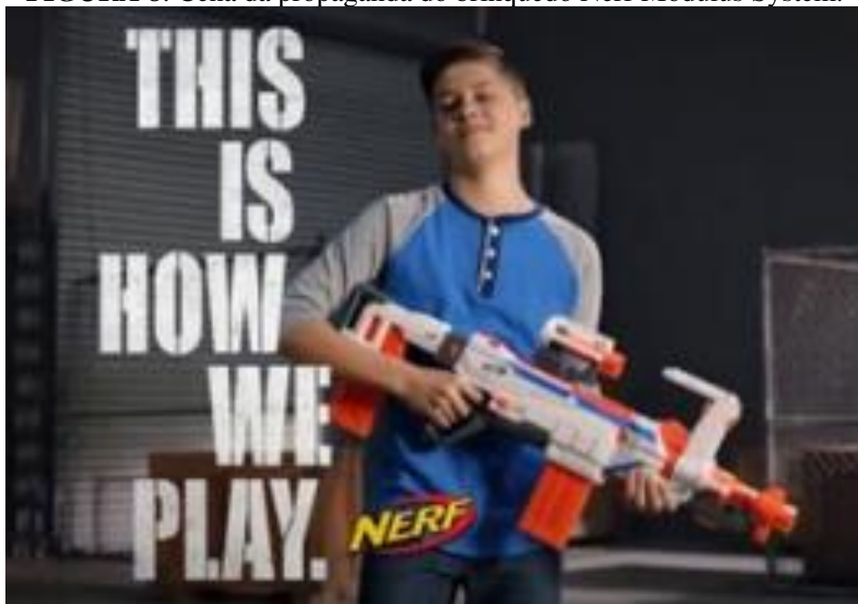
FIGURA 8: Cena da propaganda do brinquedo Nerf Modulus System.

A arma é um objeto com o propósito de matar, feita para tirar vida de pessoas e isso promove uma subjetividade que é o avesso do cuidado e carinho pela vida.