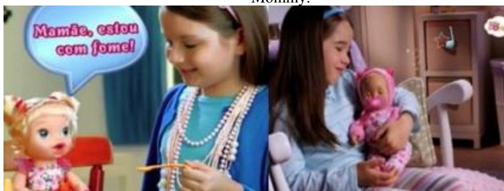
FIGURA 2: Cenas das propagandas Baby Alive Hora de comer e Little Mommy .

O ideal de maternidade é muito frequente e presente nos artefatos culturais da propaganda. Podemos observar que muitas bonecas vêm com a função de dialogar com suas mães, no caso as meninas, como nas propagandas Baby Alive Hora de Comer , em que a boneca diz a frase - “ Mamãe, estou com fome ” e na propaganda Little Mommy , em que a boneca diz “xixi”, “cocô”, para que sua “mãe” (a menina) a limpe e também a faça dormir. Vemos abaixo algumas cenas da referida propaganda.