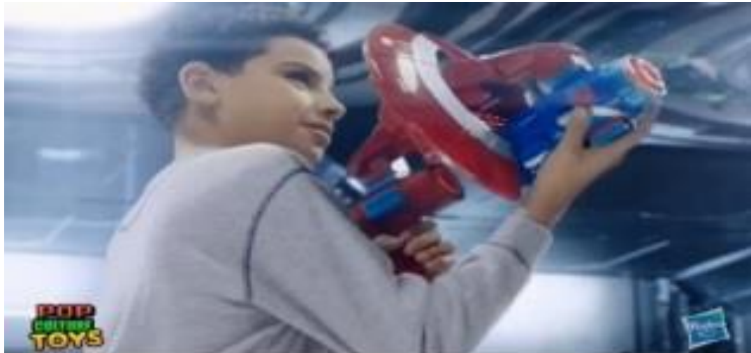
FIGURA 5: Cena do brinquedo Marvel Avengers Lançadores.

operando armas de brinquedo. Essa relação direta entre meninos e armas pode ser elucidativa de uma construção de uma masculinidade hegemônica expressando ações de violência e agressividade exclusivamente para os meninos.