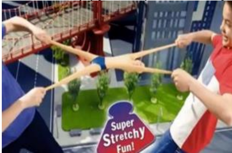
FIGURA 6: Cena da propaganda do brinquedo Stretch Armstrong .