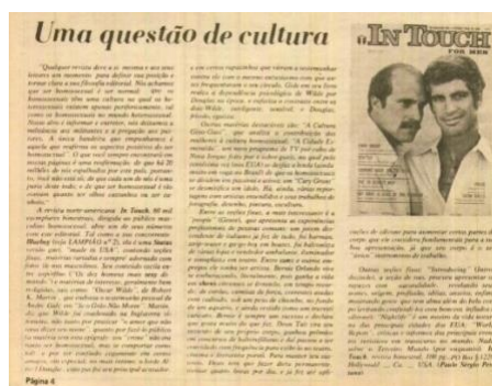
FIGURA 2: Artigo “Uma questão de cultura” da edição de número 3

Ou seja, a produção discursiva veiculada no jornal opera na construção de uma pedagogia que investe na politização das identidades de gênero e sexuais. Estas, por transgredirem as fronteiras e as normas impostas pelas diversas pedagogias de gênero e sexualidade, reiteradamente acionadas no âmbito da cultura, precisariam através da sua coletividade e unidade, pleitear reconhecimento e lugar e, conseqüentemente, sua ampliação e acessos, saindo dos ambientes marginais e subalternos da vida social.