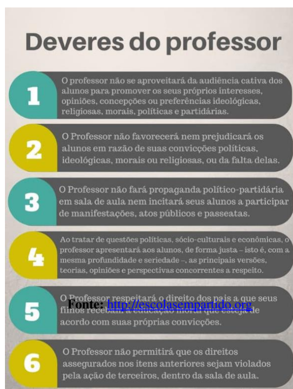
Figura 1: Cartaz difundido pelo MESP com os deveres do professor

O cartaz evidencia o posicionamento conservador do movimento numa pedagogia da negação da atuação escolar. Aponta que as/os docentes não podem deixar transparecer em suas aulas: as suas convicções morais, políticas, religiosas ou partidárias, não sendo permitido, inclusive, incentivar a participação das/os escolares em manifestações sociais e políticas, em grêmios estudantis, em assembleias do movimento estudantil e tampouco incentivar o debate de temas controversos e políticos em sala de aula.