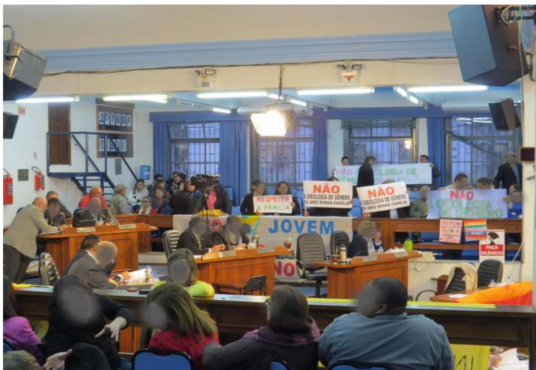
FIGURA 1: Foto da votação do PME na cidade de Bagé/RS em 2015.

MELCHIORI, 2009) e que qualquer outra configuração familiar que se distancie desse padrão, passa a ser uma configuração inferior, de menor valor, ou ainda, no caso de famílias com duas mães ou dois pais, algo considerado em suas perspectivas como “desviante”, ou seja, uma afronta social.