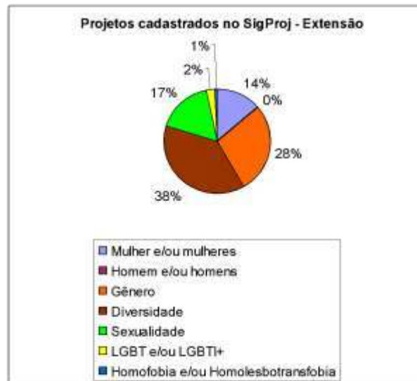
Gráfico 2: Projetos de extensão cadastrados no SIGPROJ

No âmbito da categoria “extensão”, pelo gráfico 2 demonstramos o quanto a abordagem de temáticas de gênero e sexualidade tem sido contempladas, sendo identificadas um total de 216 propostas cadastradas.