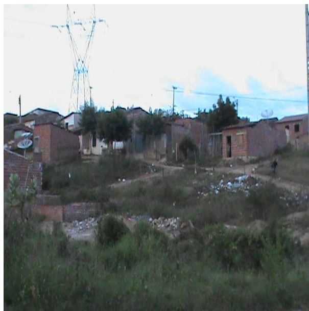
FIGURA 5 - Bairro Vila União com visível ausência de infraestrutura FONTE: LIMA, 2013.

Considerando então o sentido da reorganização e dinâmica urbana em exposição, vê-se que o centro da cidade se dirige a uma condição mais comercial do que residencial, ensejando no resto da cidade, o brotar de novos subcentros, resultando aí em uma reestruturação intraurbana, que como despacho final em Sobral, credenciam-se novos aportes infraestruturais e circulatórios, visualizados a partir da presença de importantes avenidas e bairros como: