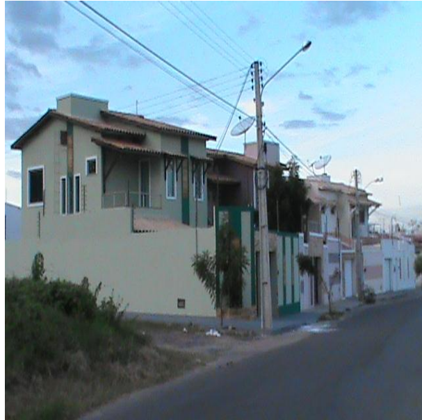
FIGURA 6 - Residências de alto valor no bairro Renato Parente

Este bairro em Sobral é um dos que mais se expande e materializa novas formas de consumo e recortes do solo urbano, alimentando investidores, degradando novos espaços de natureza, uma vez que o mesmo está aos “pés” da Serra da Meruoca, o que instiga aos novos residentes ter contato mais íntimo com a natureza.