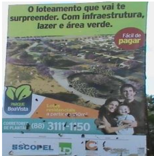
FIGURA 2 - Agentes Imobiliários na mercadorização do solo urbano, Bairro Várzea Alegre

O apelo midiático anterior além de instigar o consumo das moradias dos sonhos na cidade expandida e segregada materialmente, via parcelificação do solo urbano, também reforça o papel de importância que a cidade em discussão possui, enquanto espaço urbano do sertão cearense de forte expressividade regional, fato que impulsiona e atrai os diferentes profissionais e investidores imobiliários, bem como de atividades comerciais correlatas, na perpetuação dos processos de incorporação e de nova materialização em novos espaços da/na cidade, onde cada qual destes atua com suas diferentes intenções capitais, tal qual observa-se pela passagem da matéria jornalística, logo abaixo.