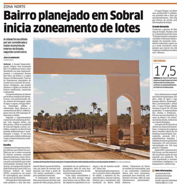
FIGURA 3 - Chegada de novos empreendedores imobiliários em Sobral

O apelo midiático anterior além de instigar o consumo das moradias dos sonhos na cidade expandida e segregada materialmente, via parcelificação do solo urbano, também reforça o papel de importância que a cidade em discussão possui, enquanto espaço urbano do sertão cearense de forte expressividade regional, fato que impulsiona e atrai os diferentes profissionais e investidores imobiliários, bem como de atividades comerciais correlatas, na perpetuação dos processos de incorporação e de nova materialização em novos espaços da/na cidade, onde cada qual destes atua com suas diferentes intenções capitais, tal qual observa-se pela passagem da matéria jornalística, logo abaixo.