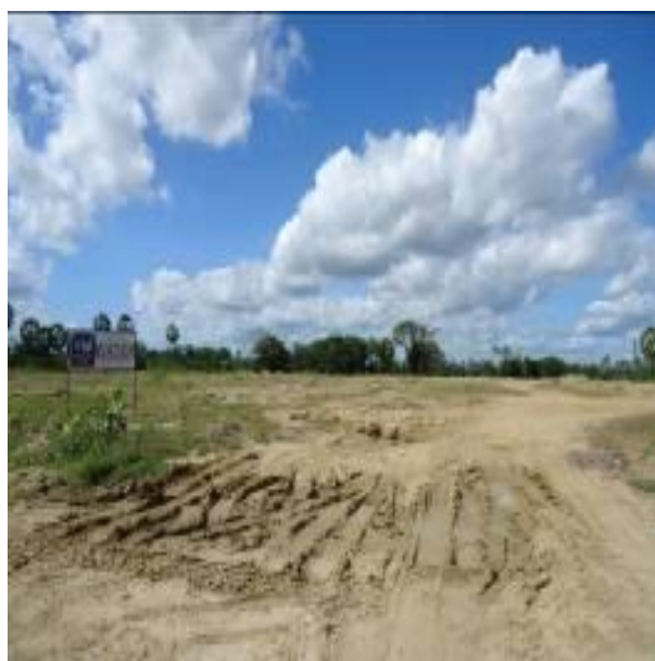
FIGURA 4 - Espaços de especulação imobiliária – Bairro Várzea Grande FONTE: LIMA, 2013.

Este fato perpetua condições para a prática desenfreada de espaços de especulação imobiliária, alimentando não só a espera material de reorganização espacial, a partir de infraestruturas permitidas que seja pela atuação do Estado, como também de particulares, como também, uma espera capital, pois, os estoques de terras de alto valor para onde cidade expande-se determinam o potencial da capacidade social de consumo dos compradores/investidores, bem como do desejo dos mesmos em afastar-se das conturbadas condições diuturnas que marcam o cenário da cidade de Sobral em momento atual. Nesse sentido, a referida prática é visualizada na figura 4 abaixo: