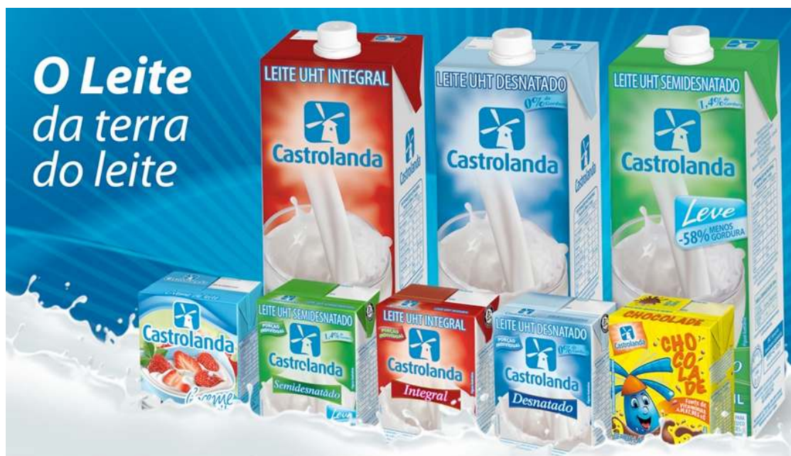
Figura 2: Leite comercializado pela Cooperativa Castrolanda.