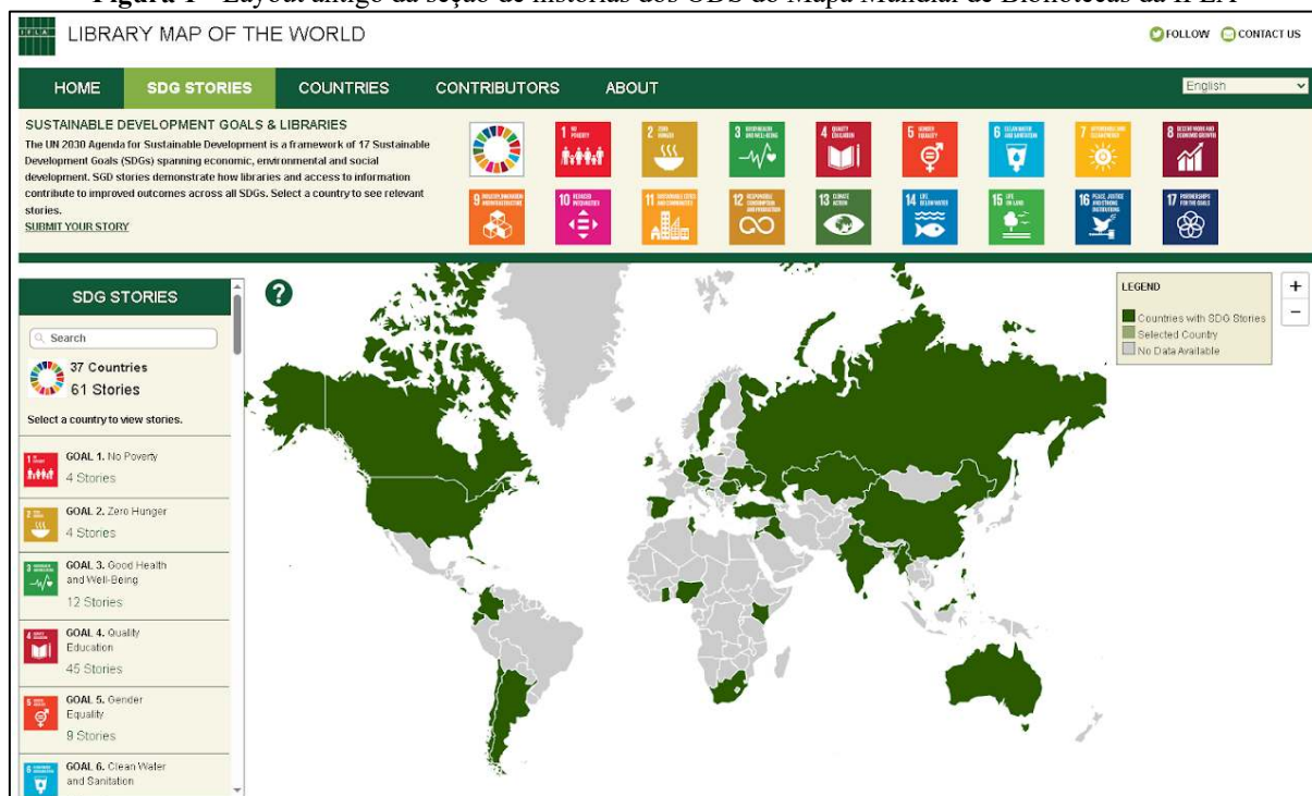
Figura 1 - Layout antigo da seção de histórias dos ODS do Mapa Mundial de Bibliotecas da IFLA