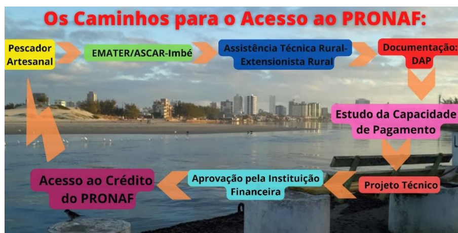
Figura 2 - Os caminhos burocráticos percorridos para o pescador artesanal acessar o PRONAF.

para essa população tradicional de pescadores artesanais de Imbé, pois na opinião dele, o sistema privado de crédito não tem linhas de financiamentos compatíveis com a realidade financeira destes pescadores. O desenvolvimento do primeiro projeto técnico realizado em Imbé pelo Extensionista Rural B, foi fruto de um trabalho de divulgação e de tentativas de legalização documental dos pescadores artesanais, pois muitos deles, segundo o burocrata, não possuíam se quer o Cadastro de Pessoa Física (CPF) e depois foi seguido os mesmos passos para o desenvolvimento dos outros projetos técnicos.