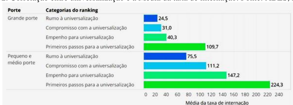
Figura 2. Correlação entre universalização e a Média da taxa de internação.

A Associação Brasileira de Engenharia Sanitária e Ambiental - ABES (2020) - utilizou indicadores para compor um ranking de universalização do saneamento o que se consolidou como instrumento de análise do setor. O ranking apura os impactos da ausência ou precariedade do saneamento e apresenta um panorama nos municípios. A edição de 2020 reuniu 1857 destes municípios, representando 70% da população do país. Um dados interessante apresenta indicadores que correlacionam o acesso ao saneamento, com doenças relacionadas à veiculação hídrica. Conforme mostrado na Figura 2, os municípios que foram considerados com compromisso e rumo à universalização possuem a menor incidência de internações.