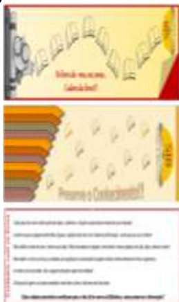
FIGURA 3 – Marca página sobre cuidados com as obras