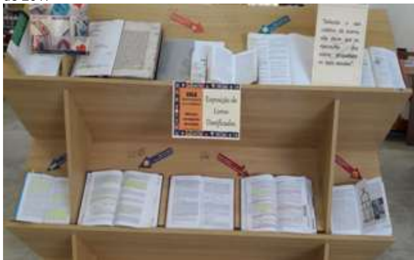
FIGURA 4 – Exposição de material bibliográfico danificado no ano de 2017