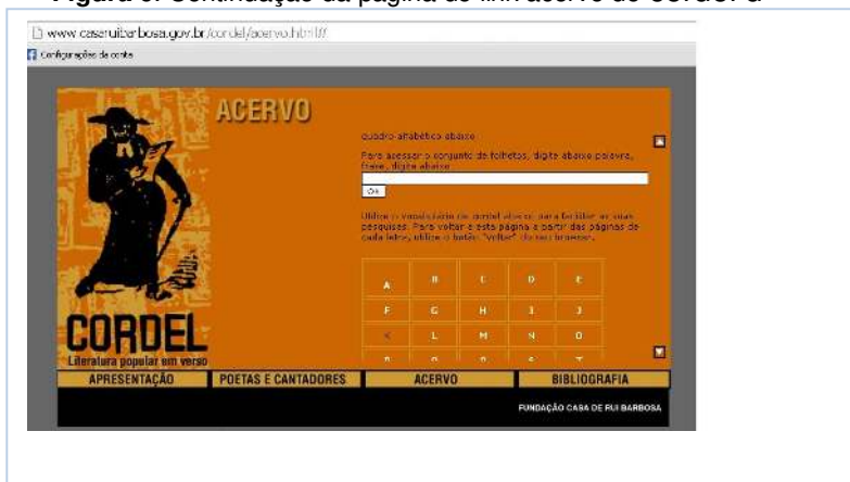
Figura 6: Continuação da página do link acervo de cordel d