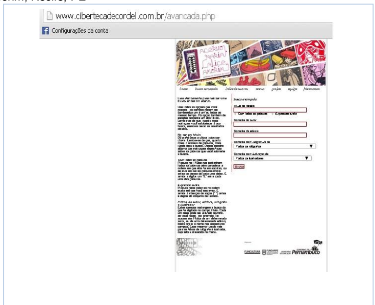
Figura 2: Página de busca avançada do acervo de cordel de Maria Alice Amorim, Recife, PE

dificuldade semântica para o usuário. O site conta com uma busca avançada, indicada na parte superior do menu da página principal. Esta busca conta com o uso de operadores booleanos, permitindo o cruzamento de termos, essencial para o processo de obtenção de informação específica. Para isso, é necessário que o usuário digite a informação requerida em mais de um campo e clique em “busca”. Na Figura 2, é apresentada a tela da busca avançada do site supracitado: