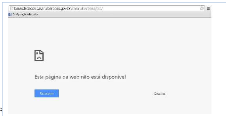
Figura 4: Página do link da base de dados do acervo de cordel da Fundação Casa Rui Barbosa, Rio de Janeiro, RJ

A página principal possui interessante apelo visual, contudo, constatamos lentidão no momento em que acessamos. Morville e Rosenfeld (2006, p. 99, tradução nossa) dizem: “a aplicação coerente de fontes, tamanhos de fonte, cores, espaços em branco e agrupamento pode ajudar visualmente reforçar o caráter sistemático de um grupo”. Quanto ao seu menu para o acesso às informações pontuais do site , percebemos o uso de termos claros e diretos. Chamamos a atenção para o termo “acervo”. Ao clicar nele, o site supostamente levar-nos-ia a alguma caixa de busca. Entretanto, aparece um texto que indica o descritor “base de dados da Biblioteca”. Fazemos uso constante a esse site desde 2011 e quase sempre esse link encontra-se inacessível, conforme ilustra a Figura 4: