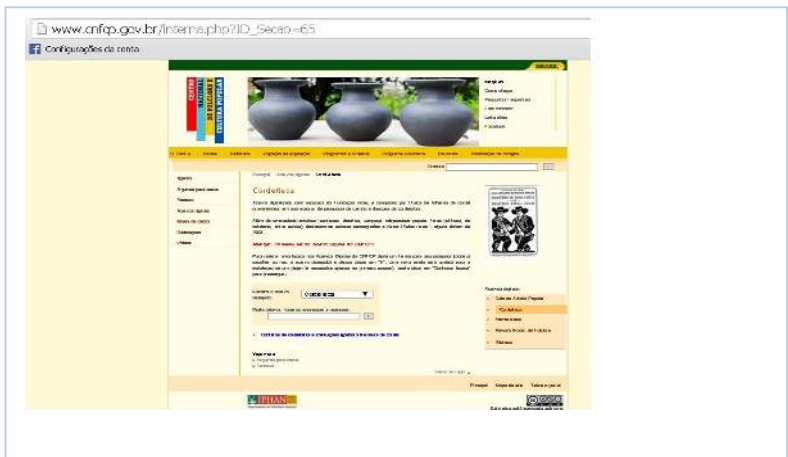
Figura 7: Página da Cordelteca do Centro Nacional de Folclore e Cultura Popular, Rio de Janeiro, RJ

Fonte: Centro Nacional de Folclore e Cultura Popular (2014) Afirmamos que a busca pelo Google , em relação à página eletrônica da Cordelteca do Centro Nacional de Folclore