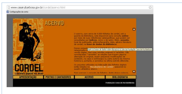
Figura 5: Página do link acervo de cordel da Fundação Casa Rui Barbosa, Rio de Janeiro, RJ

Biblos :Revista do Instituto de Ciências Humanas e da Informação, v. 29, n.2, 2015.