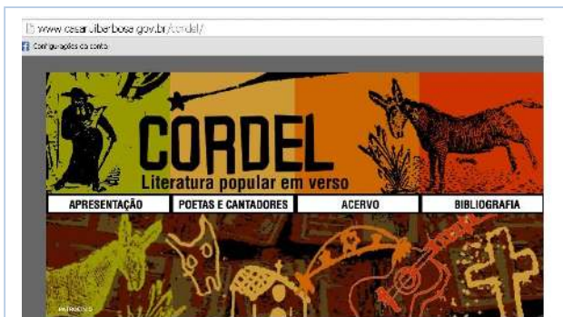
Figura 3: Página principal do acervo de cordel da Fundação Casa Rui Barbosa, Rio de Janeiro, RJ

Na segunda pesquisa, os descritores inscritos foram: Rui Barbosa cordel . Tivemos êxito na resposta, quando o Google nos remete para o seguinte site < http://www.casaruibarbosa.gov.br/cordel/ >, conforme ilustra a Figura 3: