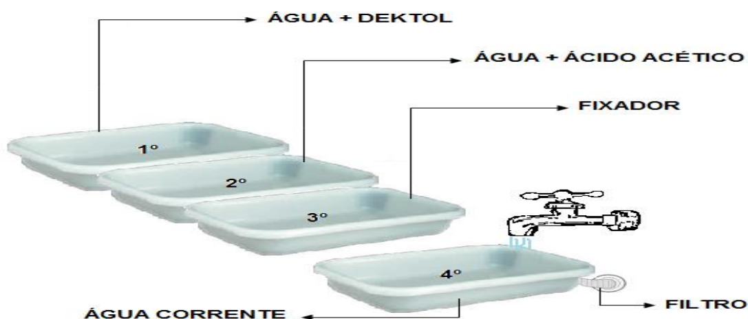
Figura 3: Processos de revelação

O primeiro passo foi reunir quatro bandejas para distribuir em cada uma delas os seguintes produtos: na primeira bandeja coloca-se o dektol, este será diluído em água e as medidas aproximadas são: Duas (2) medidas de água para uma (1) medida de dektol, o tempo de exposição do papel fotográfico pode variar de acordo com a resolução da foto, procurou-se ter cuidado para que a foto não ficasse muito escura, por isso o ideal é ter como referência uma pinça de cor preta, vale salientar que no decorrer do processo revelação o laboratório fica completamente escuro. Todavia é utilizada como exceção luz vermelha de baixa intensidade (fraca) em cima das bandejas. Já na segunda bandeja colocou-se água e ácido acético, o fotograma e/ou fotografias devem ficar submersas por um tempo máximo de três minutos. Na terceira bandeja, coloca-se o fixador, este serve para fixar a imagem no papel fotossensível, o tempo máximo de exposição é de dez minutos. A quarta bandeja, é o local onde são colocadas as fotografias e/ou fotogramas a partir do momento em que os mesmo são retirados da bandeja três (3) “fixador”. Vale salientar que as fotografias e/ou fotogramas permanecem em água corrente, por um período de tempo equivalente a trinta (30) minutos, este tempo é contado após a entrada da última foto no recipiente (ver figura 3).