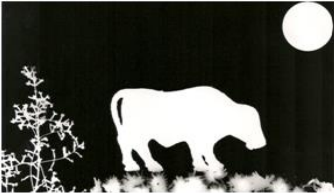
Figura 4: Luar no campo (Material cenográfico utilizado: Galho de árvore cidrão, flores de marcela, moeda e um boi de brinquedo).