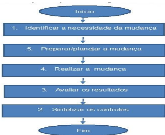
FIGURA 1 – Etapas do processo de gestão da mudança FONTE: Duarte Júnior (2009, p.2).

Duarte Júnior (2009, p.2) resume o processo de gestão da mudança nos seguintes passos: