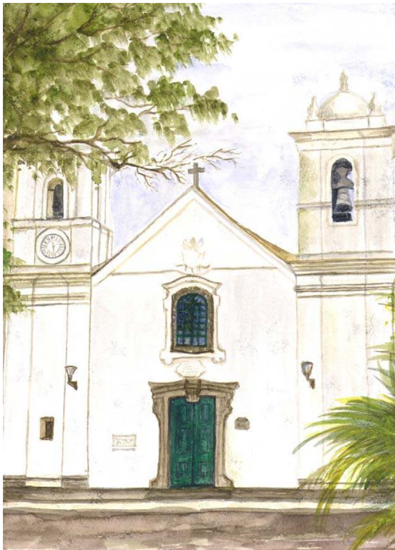
BIBLOS – Revista do Instituto de Ciências Humanas e da Informação