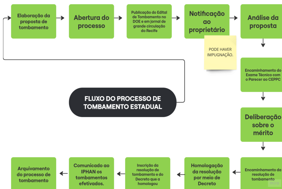
Figura 1 - Fluxo do Processo de Tombamento Estadual