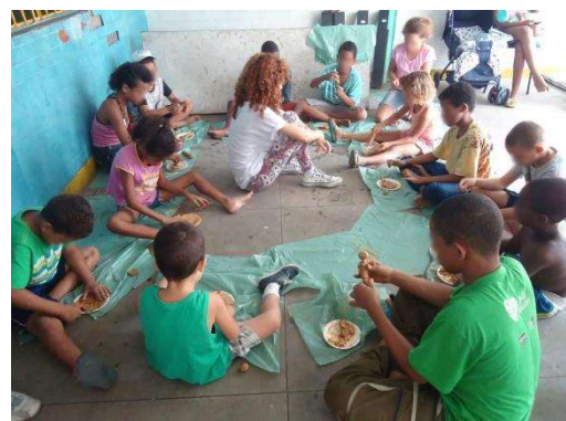
Oficina de argila.