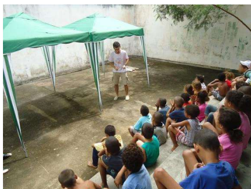
Contação de histórias.