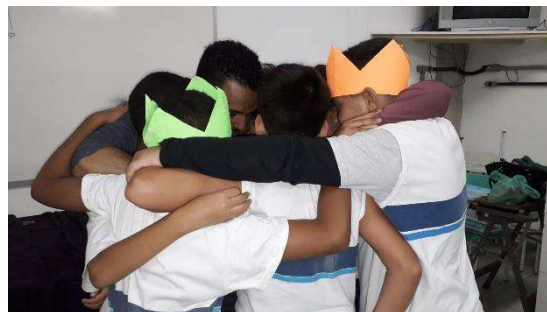
Jogos com equipes.