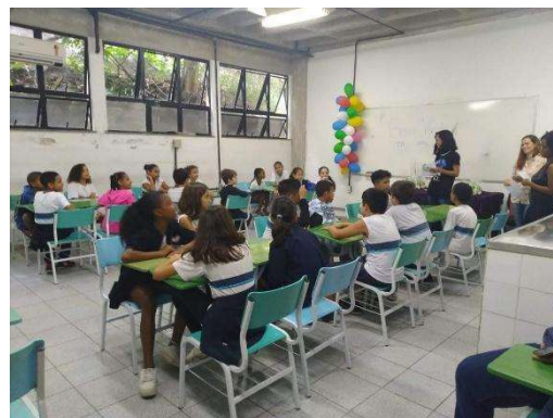
Leitura de livros infantis – momento (2)