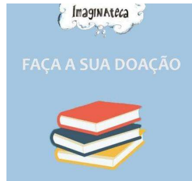
Cartaz para arrecadação de doações.