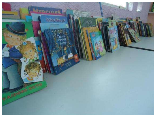
Livros arrecadados e organizados em sala de leitura.