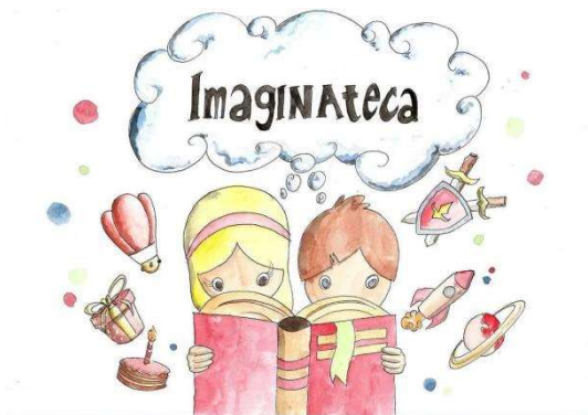
Logotipo do projeto (programação visual).