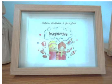
Placa: Aqui passou o Projeto Imagnateca.