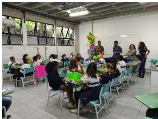
Leitura de livros infantis – momento (1)