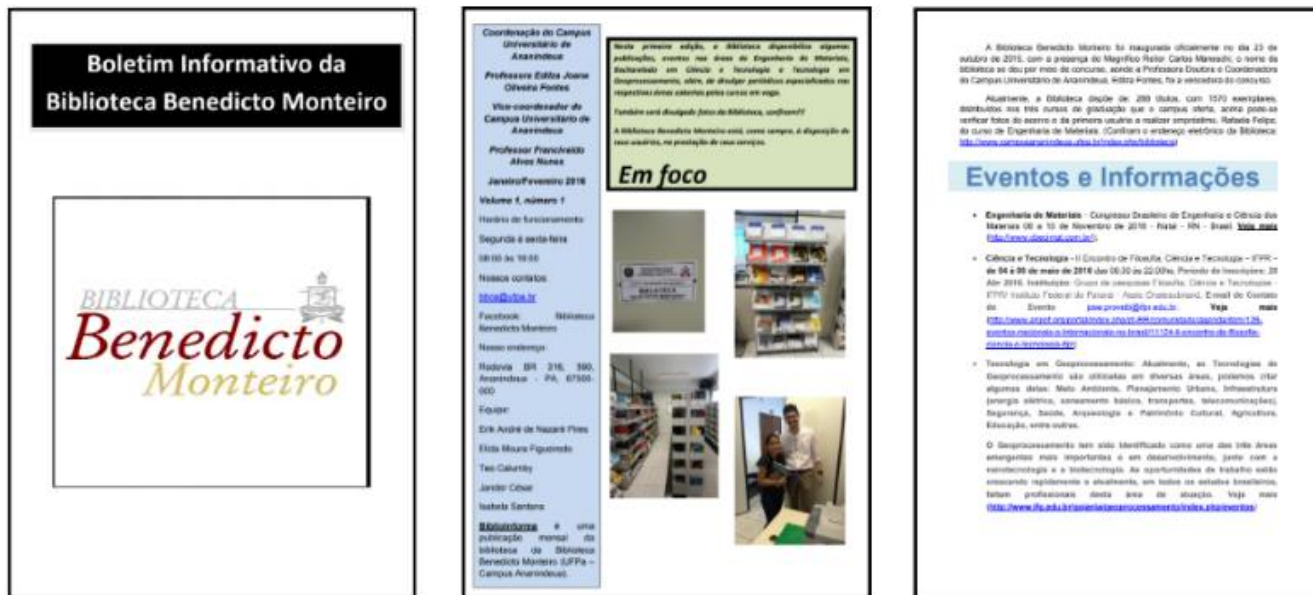
Figura 1 – Boletim informativo 2016

A seguir, as imagens de algumas edições do Biblio Informa de 2016 a 2023, revelam um pouco da evolução desse instrumento bastante utilizado por toda a comunidade acadêmica do Campus :