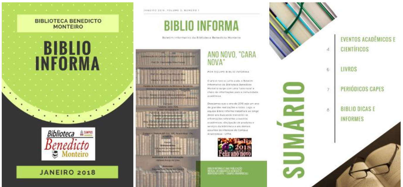
Figura 3 – Boletim informativo 2018, 2019, 2020