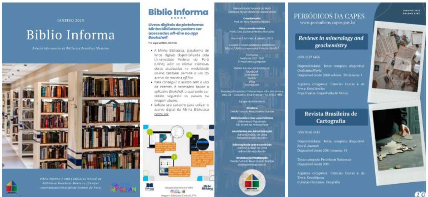
Figura 5 – Boletim informativo 2023