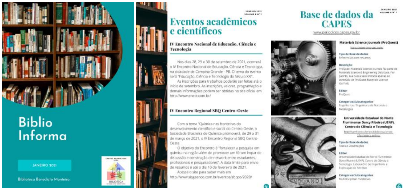
Figura 4 – Boletim informativo 2021 e 2022