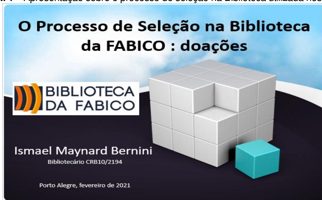
IMAGEM 1 – Apresentação sobre o processo de seleção na Biblioteca utilizada nos estágios