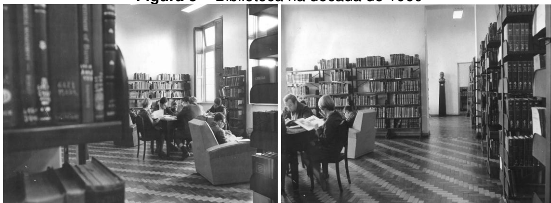
Figura 5 – Biblioteca na década de 1960