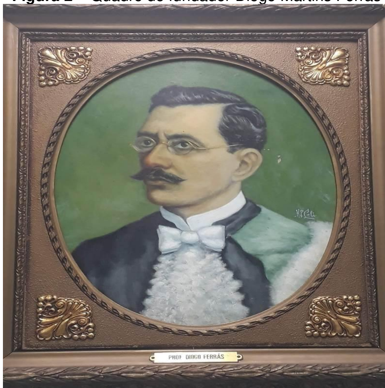
Figura 2 – Quadro do fundador Diogo Martins Ferrás