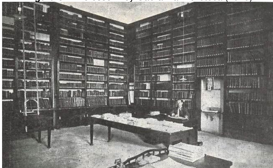
Figura 3 – Professor Ney Cabral na Biblioteca (1925)