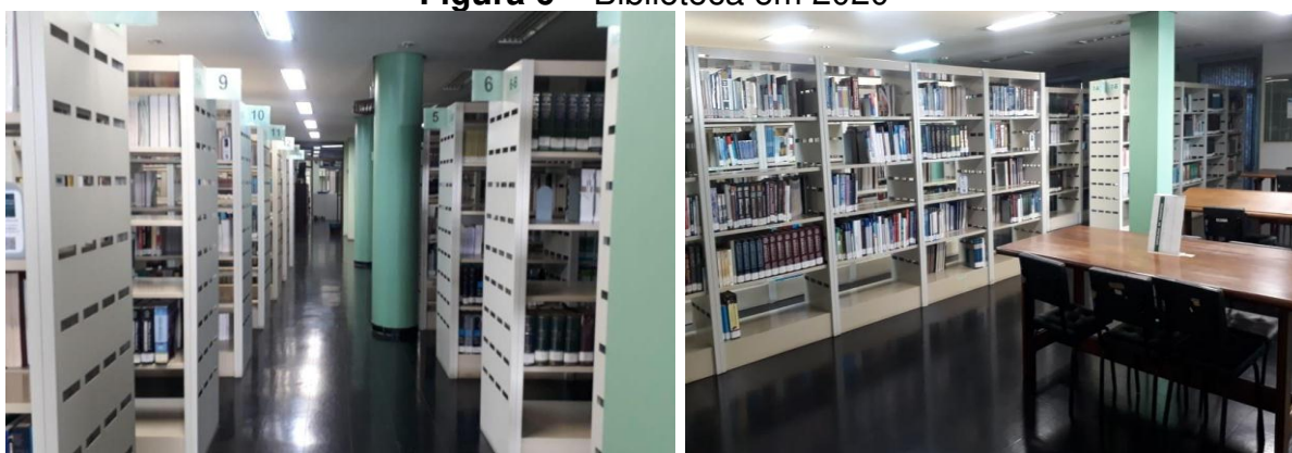
Figura 6 – Biblioteca em 2020

Atualmente, a Biblioteca conta com mais de 60.650 registros em seu catálogo, com um acervo de 754 títulos de periódicos impressos, ultrapassando o número de 118 mil exemplares, e mais de 25.600 livros e monografias, sendo que a obra mais antiga é datada de 1801. Sua equipe é composta por sete bibliotecários, quatro assistentes administrativos e quatro bolsistas. Imagens atuais da Biblioteca encontram-se na Figura 6.