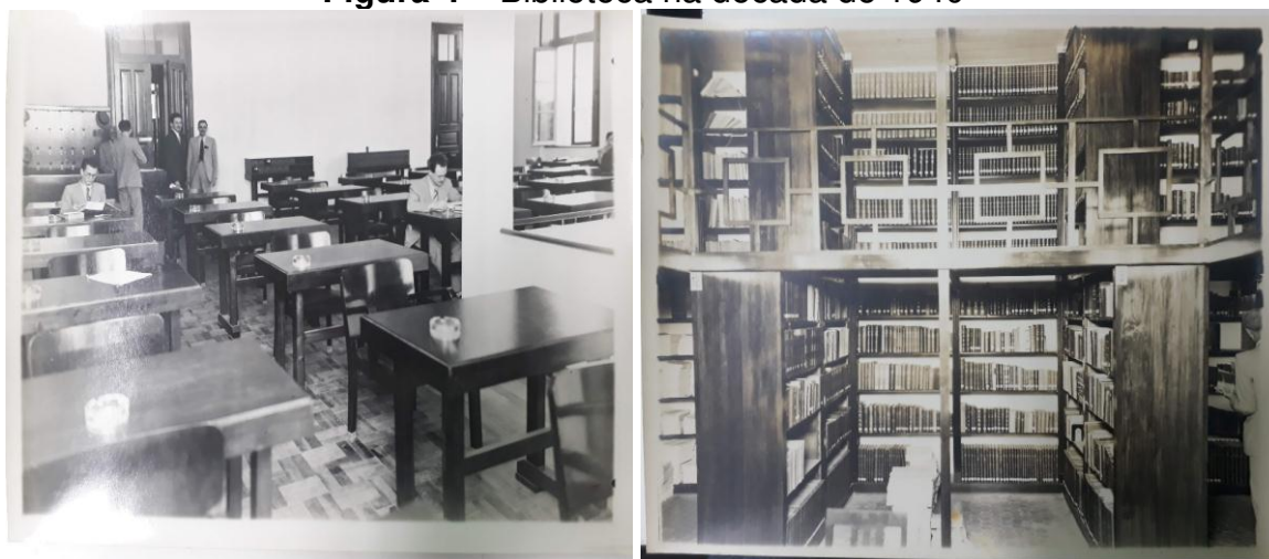
Figura 4 – Biblioteca na década de 1940