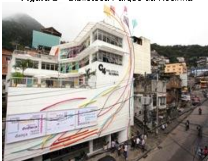
Figura 2 – Biblioteca Parque da Rocinha

Presentes nos bairros cariocas de Manguinhos, Rocinha e Centro, e também na cidade de Niterói, o projeto foi uma iniciativa do Governo Federal e Estadual, através do Programa Mais Cultura e do Plano Nacional de Livro e Leitura (desenvolvido pelos Ministérios da Cultura e da Educação) e da Secretaria de Cultura do Estado do Rio de Janeiro. Com um projeto arquitetônico planejado para crianças, a Biblioteca Parque da Rocinha foi escolhida dentre as outras bibliotecas pela facilidade de acesso e pela possibilidade de a pesquisa acompanhar a implementação de um projeto que intenta a inserção cultural de um grande número de pessoas da classe popular.