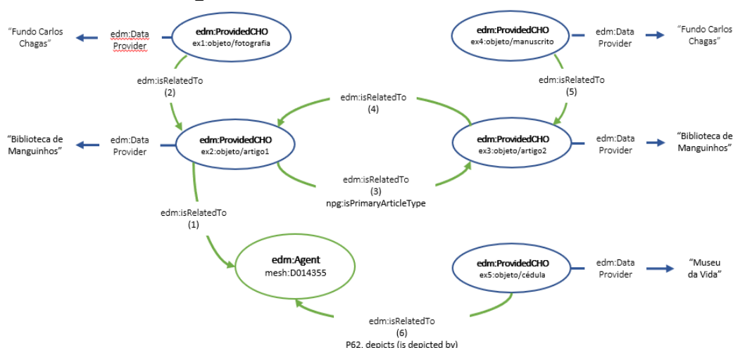
Figura 3 – Grafo em EDM dos recursos

Desta forma temos um grafo com a modelagem EDM reduzida (Figura 3), indicando o número das inferências curatoriais estipuladas e os termos localizados, indicando como os bens documentais se interligariam, promovendo a interoperabilidade dos recursos disponibilizados.