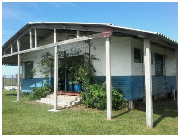
Figura 1 – Imagem da Escola Municipal

Escrever esse relato de experiência é a possibilidade de entrelaçar a relação com a comunidade e a Metodologia do Ensino da Língua Portuguesa para Crianças onde, aliamos com a experiência de monitoria. Ressaltamos que o papel era auxiliar o professor e acompanhar os alunos da turma, principalmente os que tinham mais dificuldade de aprendizado, na zona rural do município de Rio Grande/RS, podemos dizer que foi uma feliz junção. A monitoria foi realizada numa escola do município com 11 estudantes entre 6 até 13 anos de idade onde, atuava um único professor na época, atualmente, devido a morte dele a responsável pela turma é uma professora, que atende desde o primeiro ano até o quinto ano do ensino fundamental além, da escola ter uma merendeira. Vale mencionar que, o professor também era o diretor e o coordenador da escola, hoje é a professora que executa esses papéis. A seguir apresentamos a imagem da escola para que possam visualizara pequena estrutura física.