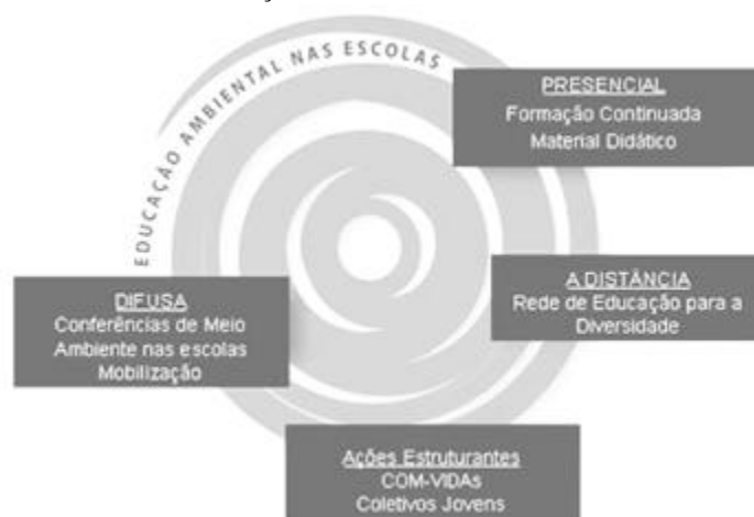
Figura 1. Representação sobre as ações de Educação Ambiental desenvolvidas nas Escolas, por parte dos Ministérios da Educação e do Meio Ambiente.