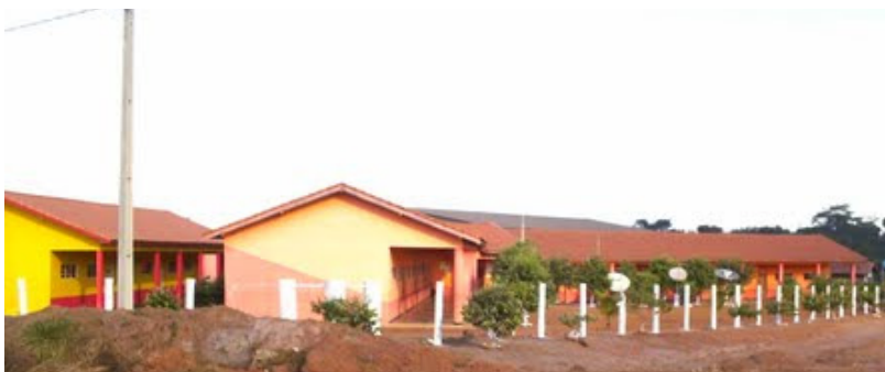
FIGURA 4 – Vista externa da escola rural localizada no Distrito de Nova Fronteira, município de Tabaporã/ MT: Escola Estadual Alfredo Treuherz