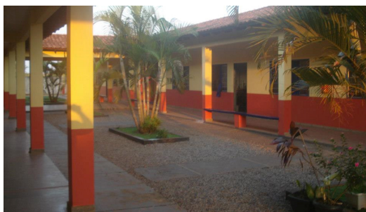
FIGURA 3 – Vista externa da escola urbana localizada no município de Tabaporã/ MT: Escola Estadual Professor Elmar Justen.