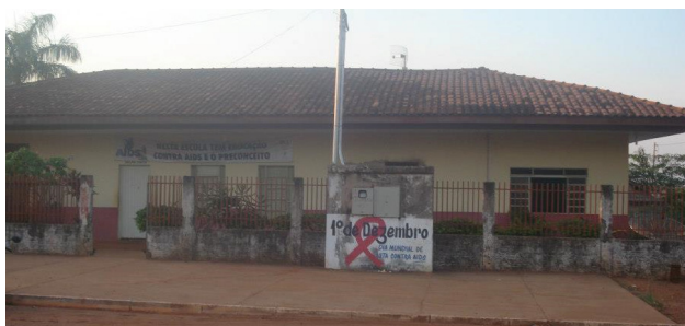
FIGURA 2 – Vista externa da escola urbana localizada no município de Tabaporã/ MT: Escola Estadual Francisco Saldanha Neto.