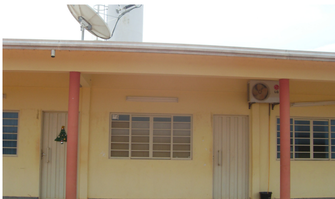
FIGURA 5 – Vista externa da escola rural localizada no Distrito de Americana do Norte, município de Tabaporã/ MT: Escola Estadual Zuleide dos Santos Barros

Para a realização do estudo foram analisados os projetos pedagógicos das escolas (PPP) e os Planos de Ensino das disciplinas oferecidas pelas escolas de 6 o ao 9 o ano. Identificou-se as áreas do conhecimento que contemplam o estudo do bioma Cerrado e da Amazônia, os conteúdos priorizados, as estratégias metodológicas adotadas. Também foram realizadas entrevistas com os docentes. As informações obtidas nos documentos foram submetidas a um processo de análise de conteúdo (BARDIN, 1977).