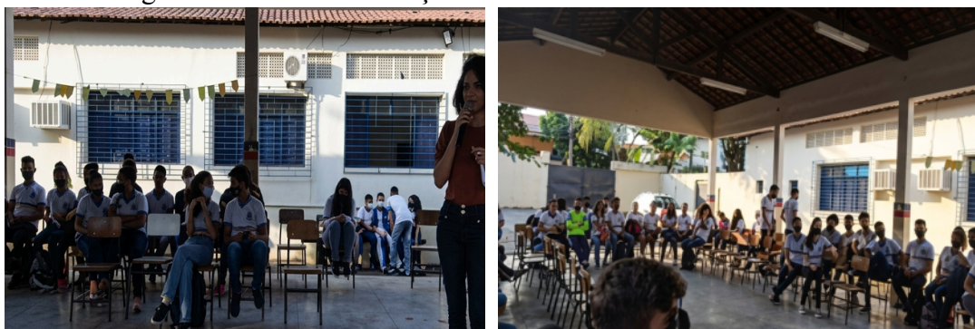
Figuras 15 e 16: Socialização dos Trabalhos com a Comunidade