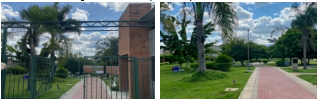
Figuras 07 e 08: Parque Municipal das Rendeiras