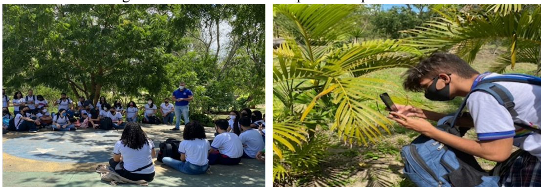
Figuras 13 e 14: Aula de Campo no Parque Severino

As práticas desenvolvidas em espaços urbanos (Figuras 13 e 14: Roda de conversa no Parque Severino Montenegro e estudante registrando a fauna e flora local) evidenciam, ainda, a interface com a educação não formal, compreendida como processos educativos que ocorrem para além do ambiente escolar e que contribuem para a formação crítica e cidadã dos sujeitos (Gohn, 2019). Essa articulação ampliou as possibilidades de aprendizagem ao integrar experiências concretas com a reflexão teórica, potencializando a compreensão dos fenômenos socioambientais em contextos reais.