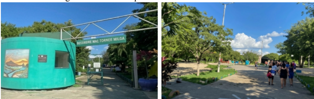
Figuras 05 e 06: Parque Botânico São Francisco de Assis

localizado às margens do Rio Ipojuca, foi inaugurado em 2015 e possui uma área aproximada de 16.000 m 2 . Considerado o Jardim Botânico da cidade, apresenta elevada diversidade de espécies vegetais, incluindo plantas nativas e frutíferas. Além de sua função recreativa, o espaço desempenha papel relevante na manutenção da biodiversidade urbana e na oferta de serviços ecossistêmicos. Sua infraestrutura contempla lago, pistas de caminhada, playground e equipamentos de ginástica, sendo amplamente utilizado pela população para atividades de lazer e convivência social (FCTC, 2020). Assim, do ponto de vista ecológico, a diversidade vegetal presente no parque favorece a manutenção de nichos ecológicos e interações bióticas, o que amplia seu potencial como recurso didático para o ensino de biodiversidade e conservação em contextos urbanos.