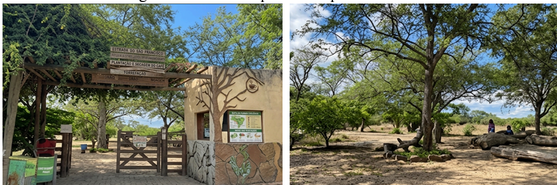
Figuras 03 e 04: Parque Municipal das Baraúnas

O Parque das Baraúnas (Figuras 03 e 04: Entrada do Parque Baraúnas e área interna do Parque Baraúnas) ocupa uma área de aproximadamente 2,5 hectares, incluindo cerca de 8.500 m 2 de vegetação preservada com espécies típicas da Caatinga. Sua implantação buscou minimizar impactos ao ambiente natural, mantendo características do ecossistema original. A área permite a realização de trilhas ecológicas, possibilitando a observação de diferentes grupos da fauna, como aves, mamíferos, anfíbios e répteis, além da diversidade florística. Destaca-se ainda o projeto “Casa Sustentável”, que apresenta práticas de uso de materiais reutilizados e tecnologias de baixo impacto ambiental, contribuindo para a educação ambiental e a compreensão de práticas sustentáveis (FCTC, 2020). Sob essa perspectiva, o parque configura-se como um espaço de aprendizagem que possibilita a problematização das relações entre sociedade e natureza, favorecendo a construção de uma consciência crítica acerca do uso e conservação dos recursos naturais.