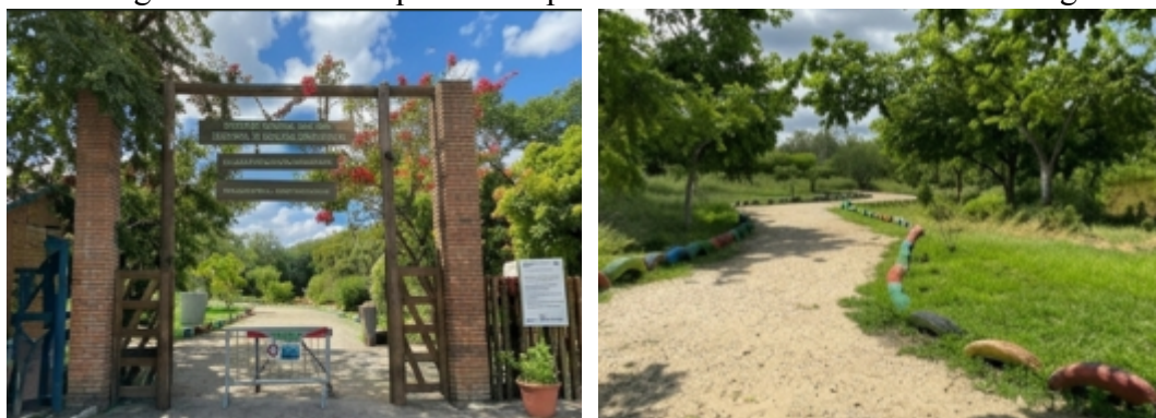
Figuras 01 e 02: Parque Municipal Ambientalista Severino Montenegro